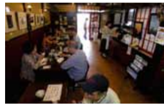
ほっと落ち着く店内