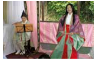
一日目のお六さんのひとりものがたり