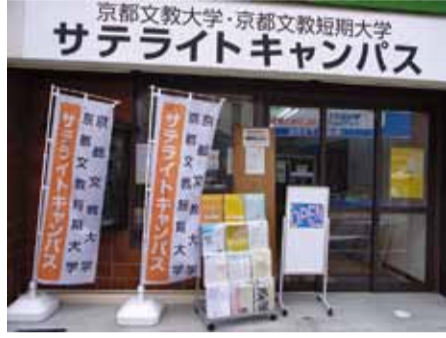
サテキャンの玄関はこんな感じです

一緒に夢を実現できる場に 京都文教大学・京都文教短期大学が、宇治の地域の方々や学生・教職員が交流し、いっしょにさまざまな企画を実現していくスペースとして、宇治橋通り商店街にサテライトキャンパス（通称 サテキャン）を6月10日にオープンされました。