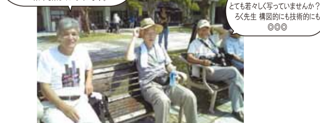
あまりに楽しそうで、若い人の力に応援して下さる気持ちがうれしくて