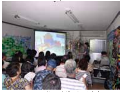
フィールドワーク報告会の様子

のフィールドワーク報告会を開催されました。学生たちがデモンストラクで体験し、調査したことを、地域の方々に伝えていただき、そして、福祉などについてともに考えることができる機会になりました。